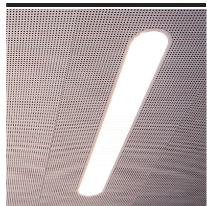
Solvalla monterad i Lobby DT med 5/10 perforering.

Solvalla, Halo, Ledvance, Stripe, Robust och Safe.