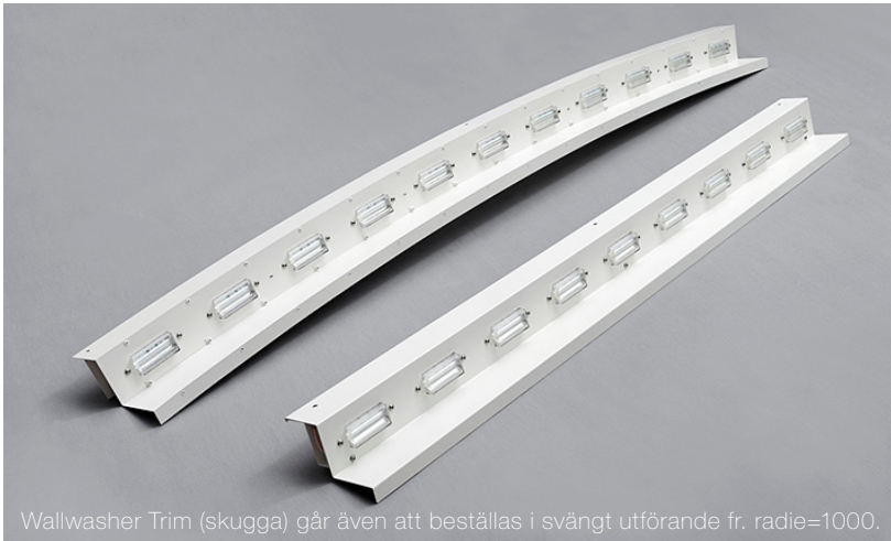
Wallwasher Trim (skugga) går även att beställas i svängt utförande fr. radie=1000.