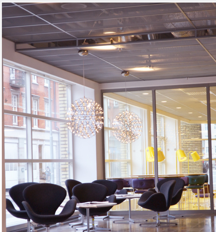
Projekt: Sweco, Malmö | System 600M i kant A-utförande.