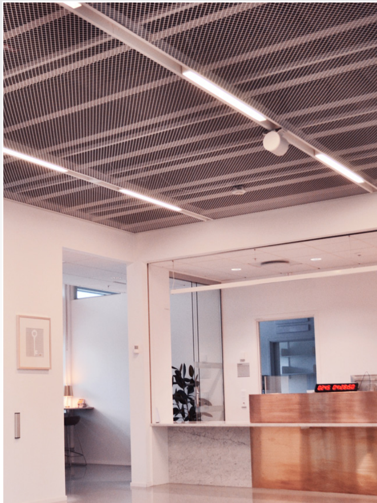
Projekt: Max IV, Lund | System 200A.