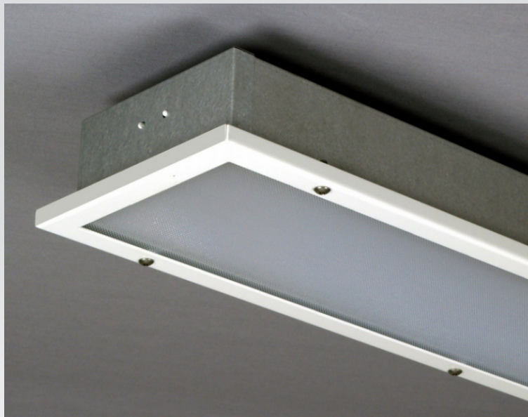
Safe | Chassi och ram