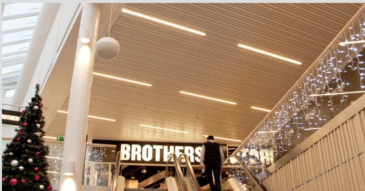
Stripe Ribb | Referens