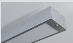
Stripe | Opalt bländskydd