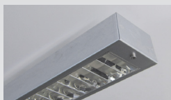
Stripe | Reflektoraster